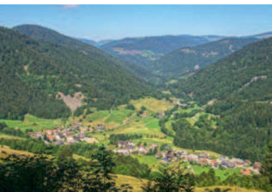
Oben: Die Sonnenseite des Schwarzwaldes: Blick vom keinen Spießborn in Bernau Mitte: Blick von Wilfingen: Abendstimmung mit Alpenpanorama Unten: Blick in den Gletscherkessel Präg mit Blockschutthalde „Seehalde“

Der Südschwarzwald ist eine Kulturlandschaft. Wer genau hinschaut, kann es noch erkennen an den Mauern und Steinhaufen, an den ehemaligen Gräben und an den „Kohlplatten“, wo einst in großer Zahl Holzkohle hergestellt wurde. Damals war der Schwarzwald seines Waldes fast völlig beraubt. Heute setzen wir uns dafür ein, dass nicht noch mehr Fläche wieder zu Wald wird. Die Gründe sind mannigfaltig: Der Wechsel zwischen Wald und Offenland bietet einer Vielzahl an Pflanzen und Tieren einen vielfältigen Lebensraum und den Menschen einen abwechslungsreichen Lebens- und Erholungsraum. Schon in den Jahren 2002 bis 2012 gab es deshalb ein Naturschutzgroßprojekt im Bereich Feldberg-Belchen-Oberes Wiesental und im Hotzenwald von 2005 bis 2011 ein LIFE-Projekt. Ziel dabei war immer, durch höhere Wertschöpfung einen Beitrag zur Aufrechterhaltung der Landbewirtschaftung zu leisten.